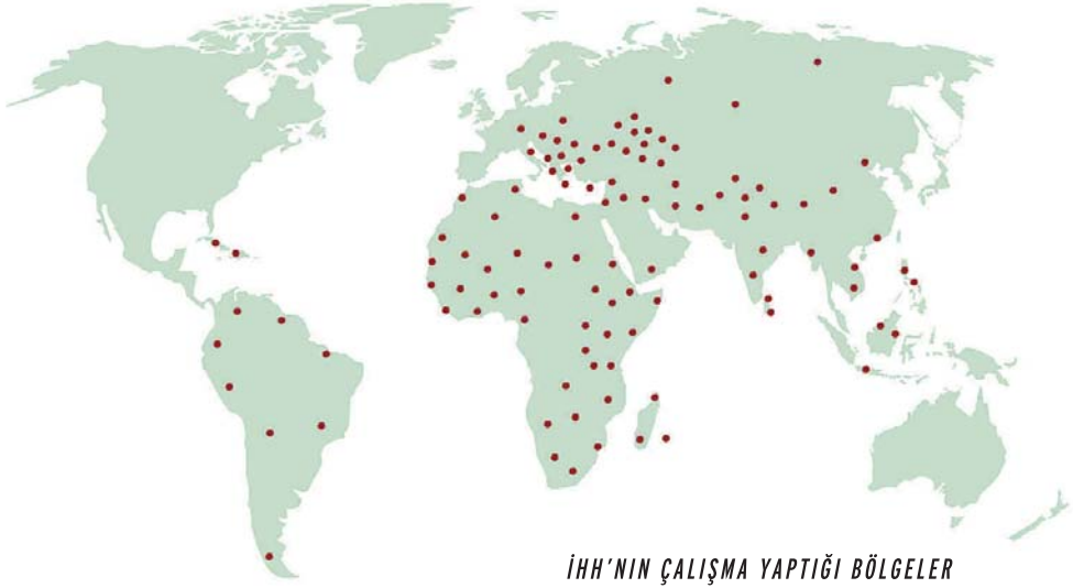
İHH'NİN ÇALIŞMA YAPTIĞI BÖLGELER